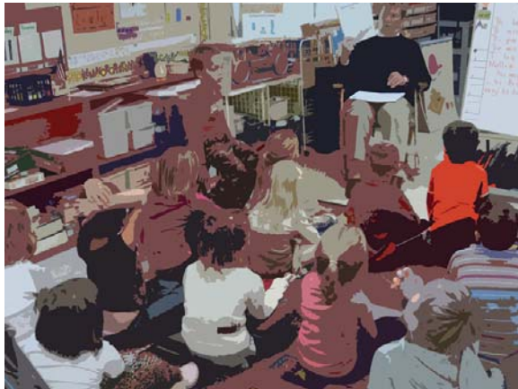
Lernen ohne Versagensängste und Schulfrust

Statt das Bildungssystem und die Ausbildung der LehrerInnen grundlegend zu reformieren, wird an hierarchischen Strukturen und traditionellen Lehr- und Lernweisen festgehalten. SchülerInnen und LehrerInnen können ihr Bestes geben, doch das System kommt ihnen nicht entgegen. Stattdessen entwickelt sich eine Kultur der gegenseitigen Schuldzuweisungen: LehrerInnen geben den Eltern die Schuld am Schulversagen ihrer Kinder, da jene sie nicht ausreichend unterstützen. Eltern machen den Unterricht der LehrerInnen für die schlechten Leistungen ihrer Kinder verantwortlich.