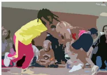
Miteinander ringen statt gegeneinander

Die soziale Spaltung der Stadt trennt nicht nur Arm und Reich, sondern separiert außerdem Migrantenfamilien in sozial benachteiligte Wohnviertel. Die Stadtteile Bremens mit dem höchsten MigrantInnenanteil (über 22 Prozent der Bevölkerung) sind: Tenever, Gröpelingen, Utbremen, Hemelingen und Grohn. In der Grundschule Glockenstraße (Hemelingen) weisen 69 von 150 SchülerInnen einen Migrationshintergrund auf (Stand: 1.11.2007). Im Gegensatz dazu gibt es in allen Schwachhauser Grundschulen bei insgesamt 1.170 SchülerInnen nur 58 mit Migrationshintergrund (Schnellmeldung Schuljahr 2007/08 der Senatorin für Bildung, 1.11.2007).