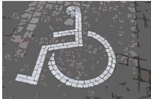
Barrierefreie Wege schaffen!

Die Förderzentren für Wahrnehmung und Entwicklung kooperieren seit zwölf Jahren mit den Regelschulen. Kooperative Beschulung bedeutet, dass die geistig gehandicapten SchülerInnen in Teilbereichen ihrer Klasse unterrichtet werden, aber auch durchgängig fächerübergreifend und projektorientiert mit der Partnerklasse (Regelklasse) lernen. Die LehrerInnen arbeiten in Teams.